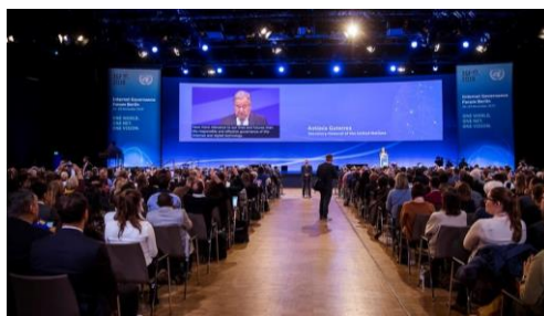
IGF 2019 en Berlín: Apertura a cargo del Secretario General de la ONU y la Canciller Alemana

El IGF funciona como un proceso de un año de duración que incluye reuniones anuales y actividades entre sesiones. Cada año, la reunión anual del IGF congrega a las partes interesadas de todo el mundo para debatir algunas de las temáticas más apremiantes de la gobernanza de Internet. Los participantes representan a gobiernos, organizaciones intergubernamentales, el sector privado, la comunidad técnica y la sociedad civil. El programa de la reunión se desarrolla de forma interactiva gracias a la participación activa de todas las partes interesadas.