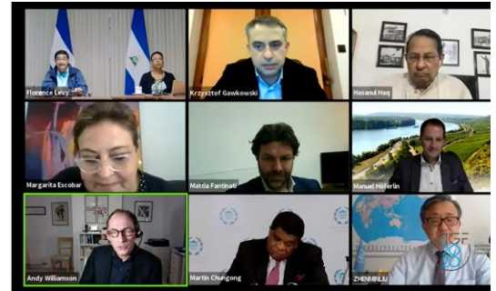
Sesión Parlamentaria en el IGF 2020, organizada en línea

El eje temático parlamentario en el IGF suele organizarse en colaboración entre el Departamento de Asuntos Económicos y Sociales de la ONU (UN DESA), la Secretaría del IGF, la Unión Interparlamentaria (UIP) y el país anfitrión.